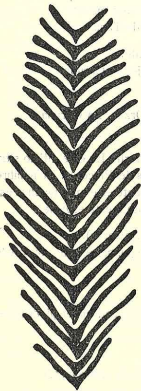
Fig. 1. Goniada galaica n. sp. Piezas quitinosas de la trompa; X 50.

Esta especie se aproxima a la G. emerita Aud. Edw., por poseer en la rama dorsal de los parápodos de la región posterior cerdas aciculares (figura 3, B); pero se diferencia de ella por tener la región anterior constituida por sólo 22 ó 23 segmentos, un mayor número de piezas quitinosas en forma de V en la trompa (figura 1), por la disposición y número de paragnatos (fig. 2) y en otros detalles referentes a la forma de los parápodos.