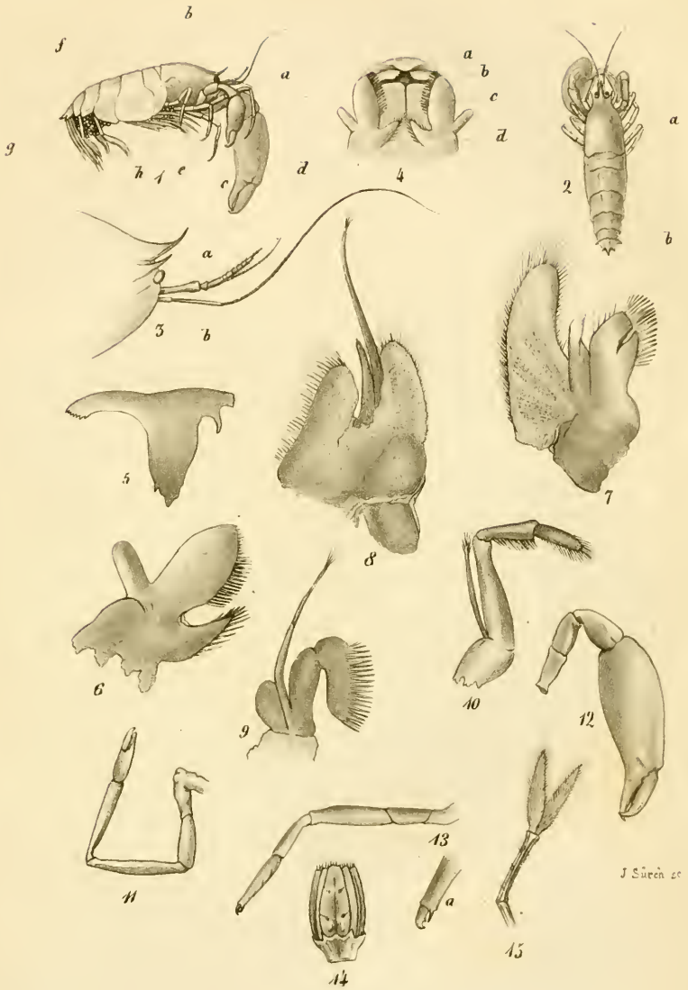
Pontonella glabra Hell.