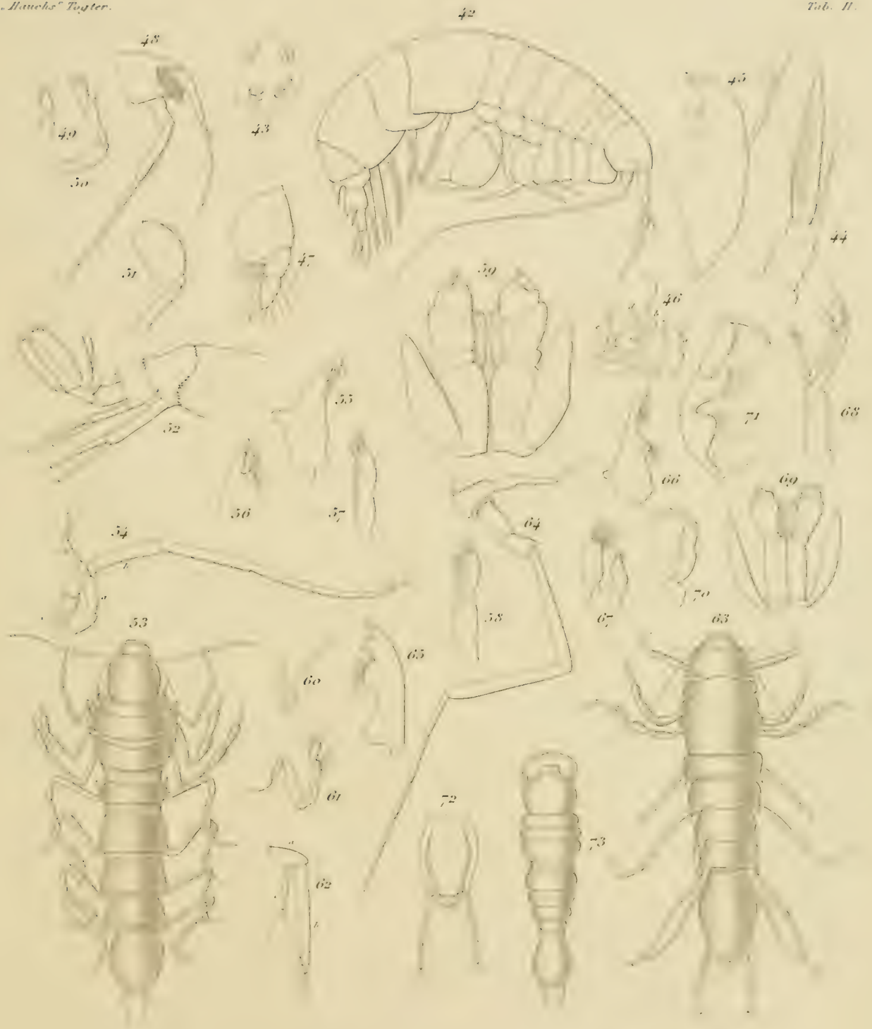
42-47. Chimeropsis danica n.g. sp.