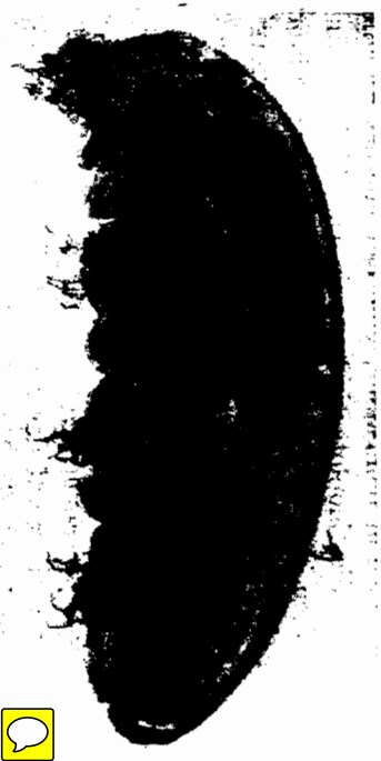
Fig. 4. Macrobiotus appelloefi n. sp. Indreöpollen bei Bergen.

einem Exemplar von 0,544 mm von 9, 6 und 8\ \mu Länge; der letzte Stab am hinteren Ende bei manchen Individuen korrodiert. Die starken Krallen paarweise vereinigt, nicht am Grunde verwachsen; das äußere Paar ungleich, das innere Paar gleich; die große Kralle des inneren Paares oft schwächer als die andere; sie ist am proximalen Ende fast gerade, am Rücken nach unten durchgebogen und dann plötzlich ge-